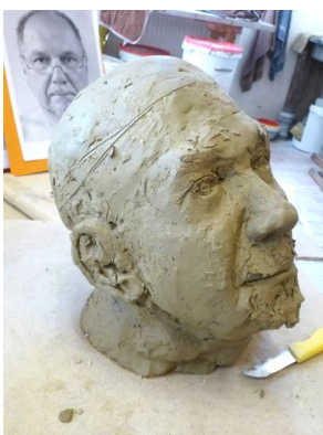
Vor den abschließenden Feinarbeiten wird der Kalotten-Schnitt geplant...