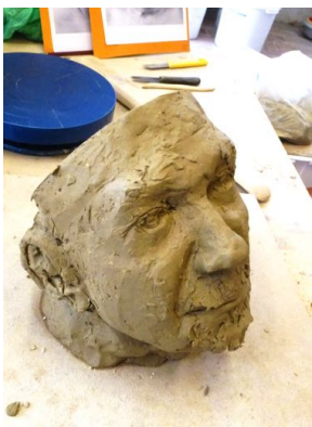
... und durchgeführt. Dann wird der Kopf ausgehöhlt (damit er beim Brennen nicht zerspringt)