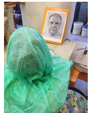
Bei längeren Pausen wird verhüllt.