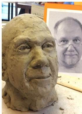
Modellieren – vergleichen – modellieren – vergleichen ...