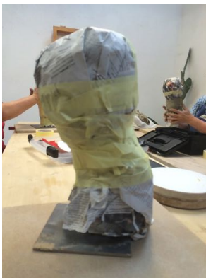
Interessanter – technisch bedingter - Beginn